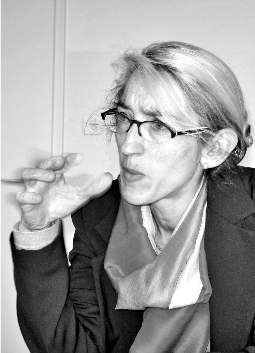
spöndlin | sozmedia

bei kommt es auch darauf an, ob die Betroffenen ein Bedürfnis danach äussern. Oft ruft die Polizei zuerst den Notfallpsychiater oder die Notfallpsychiaterin. Grundsätzlich sind die EPD nur für Notfälle bei Patientinnen und Patienten zuständig, die bei ihnen in laufender Behandlung stehen. Ansonsten sind die frei praktizierenden Psychiaterinnen und Psychiater zuständig, die gerade Notfalldienst haben, ausser es handelt sich um ein traumatisches Ereignis von grösserem Ausmass beziehungsweise mit mehreren Betroffenen, bei welchem eine spezielle Krisenorganisation zum Einsatz kommt.